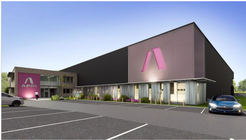
©Projet APPI à SAINT LEGER DE LINIERES